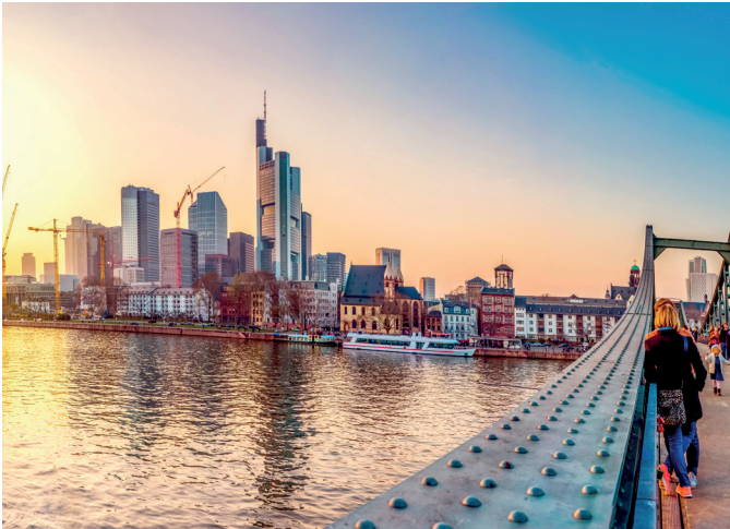
Bauplätze in Frankfurt sind „rar“ geworden - die Stadt kann den Bedarf an bezahlbarem Wohnraum nicht decken

SCHON LANGE HAT FRANKFURT IM RANKING DIE ZWEITHÖCHSTEN MIETPREISE PRO QM WOHNFLÄCHE. IN DER RHEIN-MAIN-METROPOLE IST DER QM /WOHNFLÄCHE FÜR DURCHSCHNITTLICH 9,13€ ZU MIETEN.